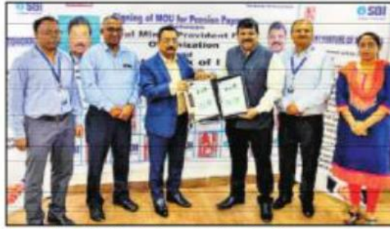
करार के दौरान सीएमपीएफओ और एसबीआई के अधिकारी।

पेंशनर की मौत पर विधवा या आश्रित को उसी पेंशन खाते से भुगतान जारी रखा जाएगा, जिससे पेंशनर को भुगतान किया जाता था। सिर्फ बैंक में मृत्यु प्रमाण पत्र देना होगा। नई व्यवस्था के नए फॉर्मेट में पीपीओ (पेंशन पे आर्डर) जारी किया जाएगा। इसकी शुरुआत एक अप्रैल 2022 से होगी। बताया गया कि जब तक सभी पेंशनरों की विस्तृत जानकारी एसबीआई को उपलब्ध नहीं कराई जाती है, तब तक पूर्व की तरह अन्य बैंकों से भी पेंशन